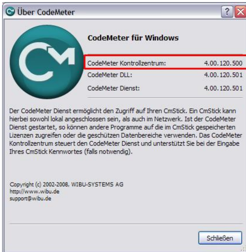
Screenshot der aktuellen Treiberversion 4.00